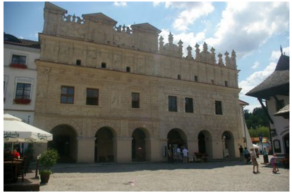
Bürgerhäuser in Kazimierz Dolny

Sehenswert ist auch die Pfarrkirche (1586-1589), mit manieristischer und barocker Ausstattung sowie einer der ältesten erhaltenen Orgeln Polens mit einer Umfassung aus Lärchenholz aus dem Jahre 1620.