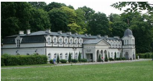
Nałęczów, altes Kurhaus

Vor uns liegen jetzt noch 51 Kilometer bis Lublin. Wir fahren auf kleineren Straßen, durch den Ort auf der 2520L, links abbiegen auf die 2547L, später links abbiegen auf die 2549L und über weitere Landstraßen durch Wąwolnica bis Nałęczów .