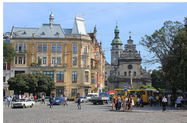
Galizische Platz

1256 errichtete der Fürst des Rus-Fürstentums Galizien-Wolhynien an der Stelle des heutigen Lemberg eine Burg für seinen Sohn Lew. Von diesem Lew (altostslawisch für Löwe) hat die Stadt ihren Namen - Lwow (bzw. dem Löwen) gehörend. Auch im Wappen und in zahlreichen Steinskulpturen der Stadt taucht der Löwe immer wieder auf. Die günstige Lage an der Kreuzung der Handelswege ließ die Stadt schnell wachsen. Es waren unruhige Zeiten, Mongolen verwüsteten die ganze Gegend.