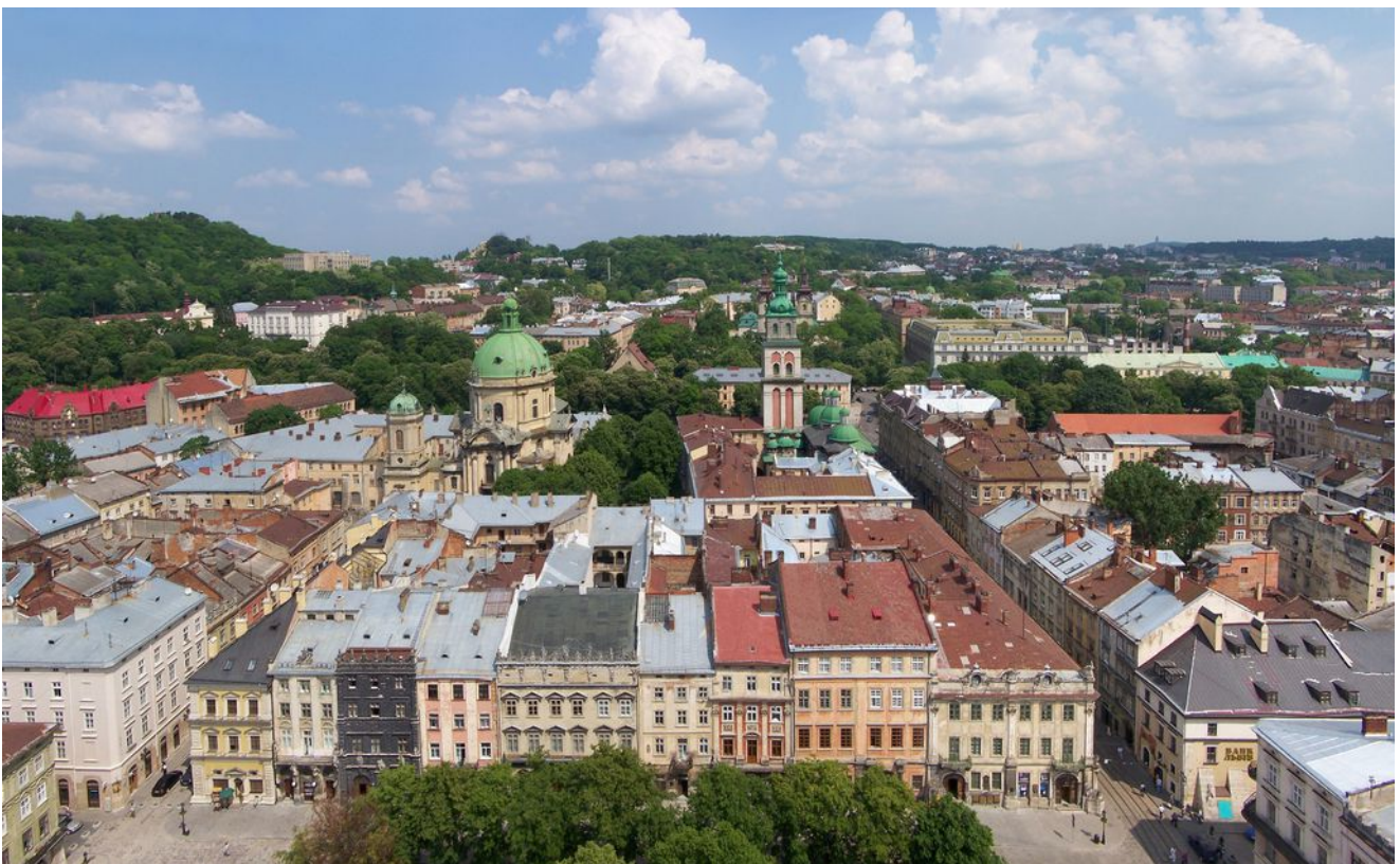
Lemberg: Panorama der Altstadt