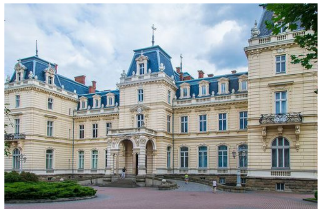
Pałac Potockich

Als die Stadt im Zuge der Lwiw-Sandomierz-Operation 1944 wieder unter sowjetische Herrschaft kam, wurden die meisten dort ansässigen Polen vertrieben. Ein Teil der Bevölkerung wurde nach der Vertreibung der dort lebenden Deutschen in Niederschlesien, vor allem in Breslau, angesiedelt. Viele Ukrainer, die zuvor im