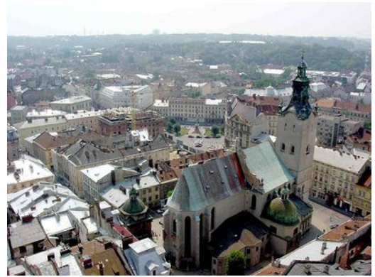
Katedra Łacińska

Zum Ende des Ersten Weltkriegs wurde in Lemberg am 1. November 1918 die Westukrainische Volksrepublik gegründet, doch errang Polen nach teilweise heftigen Kämpfen mit Ukrainern die Herrschaft. Polnische Truppen besetzten die Stadt am 21./22. November 1918. Im Nachgang kam es zu einem Pogrom gegen die jüdische Bevölkerung mit 64 Toten, viele wurden verletzt oder ausgeraubt. Zu den Opfern der Plünderungen gehörten auch Teile der polnischen und ukrainischen Bevölkerung. Der Gewaltakt erschütterte das bis dahin recht harmonische Zusammenleben der verschiedenen Volksgruppen und Religionen im Lwów der Zwischenkriegszeit nachhaltig.